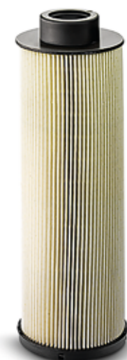
Filtro carburante a partire da 11,00 €