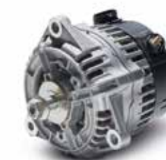
Alternatore a partire da 382,00 €