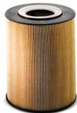
Filtro olio motore a partire da 13,00 €