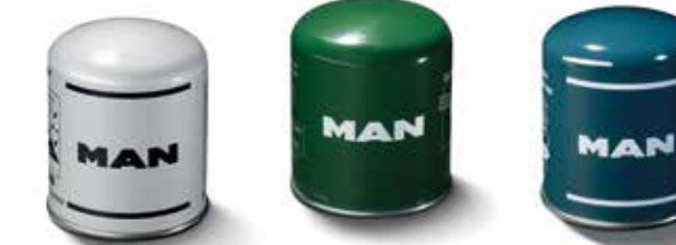
Cartuccia essiccatore aria a partire da 44,00 €