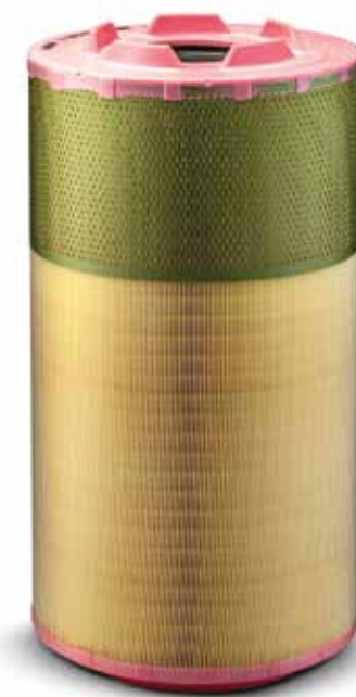
Filtro aria a partire da 63,00 €