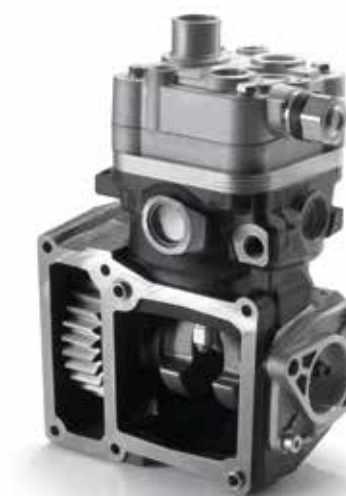
Compressore aria a partire da 1.294,00 €