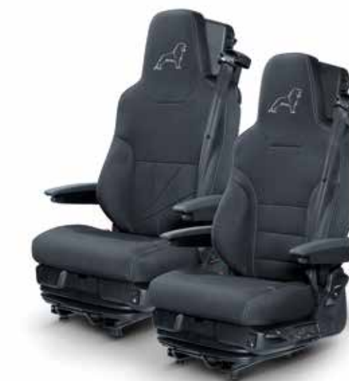
Copri sedile a partire da 95,00 €