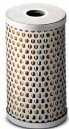
Filtro olio cambio a partire da 11,00 €