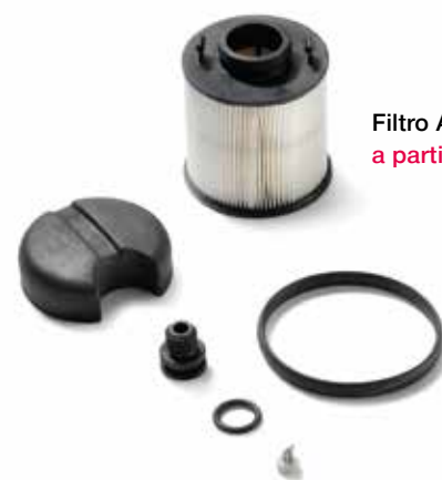
Filtro AdBlue a partire da 52,00 €