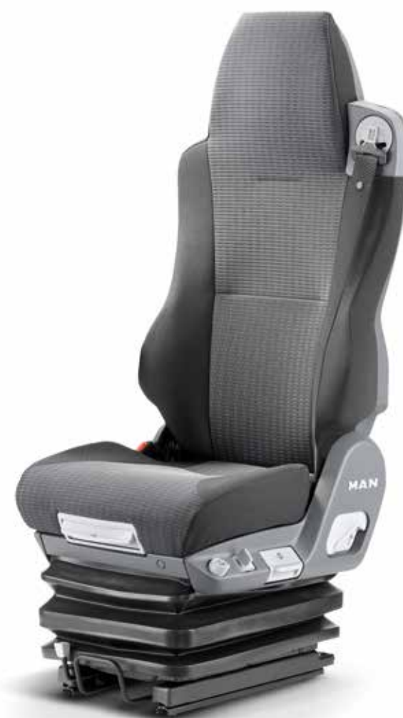
Sedili nella nuova versione rinforzata a partire da 1.190,00 €