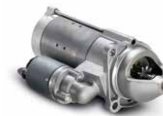
Motorino di avviamento a partire da 513,00 €