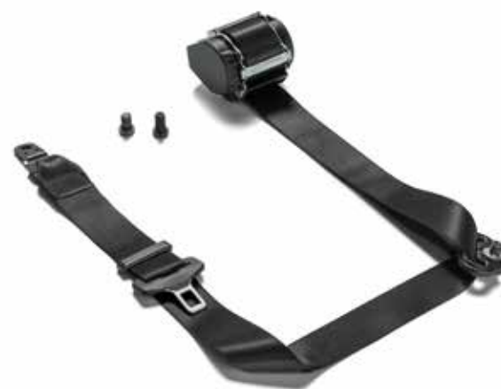
Cintura di sicurezza a partire da 178,00 €