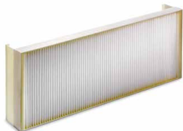
Filtro abitacolo a partire da 20,00 €