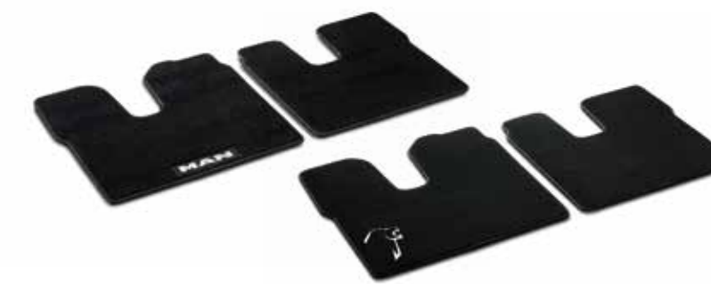
Tappetino in tessuto a partire da 66,00 €