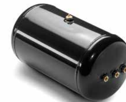
Serbatoio aria a partire da 126,00 €